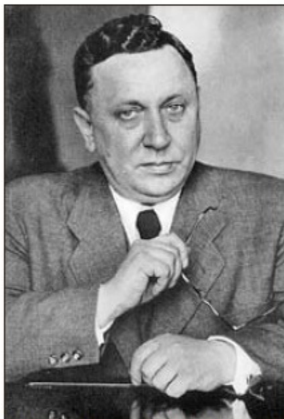
Na Śląsku urodzili się m.in. Kurt Alder, Maria Goeppert-Mayer i Fritz Haber. Wszyscy są laureatami Nagrody Nobla.